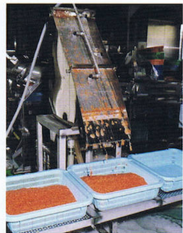
②魚卵洗浄スクリーンシュート