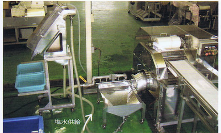
《魚卵連続分離装置FRS-102型 連結時》