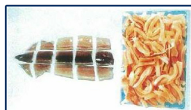
角切り及び細切り